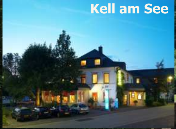
Kell am See